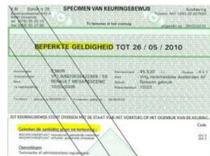
Figuur 2: groene kaart