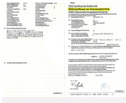
Figuur 1: witte kaart